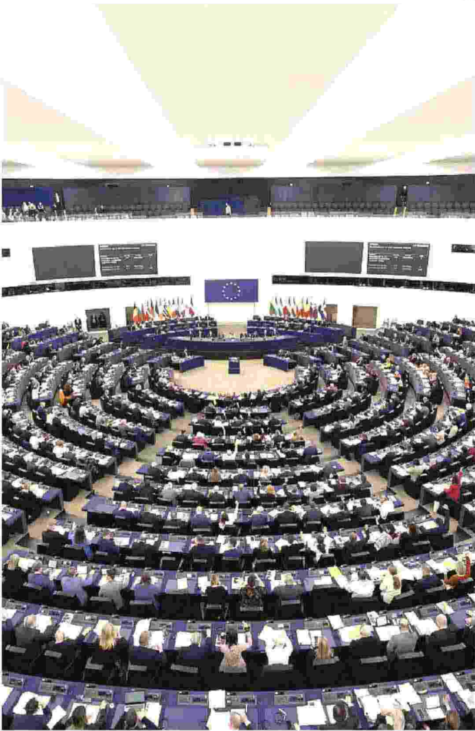
Parlamento Ue. In discussione otto direttive e regolamenti green di forte rilevanza