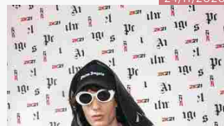
PALM ANGELS LANCIA LA CAPSULE NBA 2K21